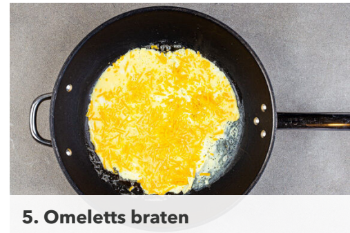
5. Omeletts braten

Die Tomaten in kleine Würfel schneiden, in die Pfanne zu dem Gemüse geben und bei mittlerer Hitze 1-2Min. erwärmen. Das Gemüse und den Bacon aus der Pfanne nehmen und die Pfanne auswaschen.