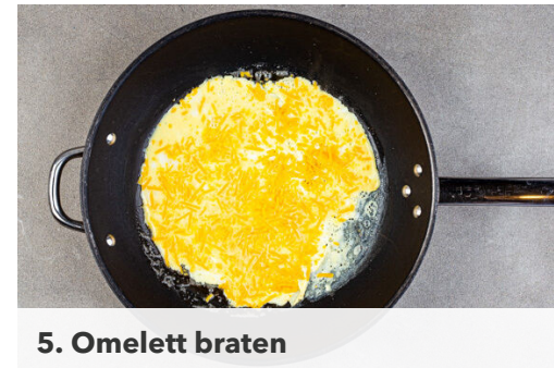
5. Omelett braten

Die Tomaten in kleine Würfel schneiden, in die Pfanne zu dem Gemüse geben und bei mittlerer Hitze 1-2Min. erwärmen. Das Gemüse und den Bacon aus der Pfanne nehmen und die Pfanne auswaschen.