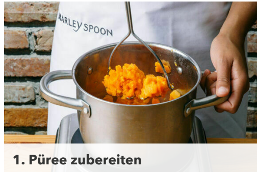
1. Püree zubereiten

Energie 551kcal, Fett 21.6g, Kohlenhydrate 49.4g, Eiweiß 32.7g