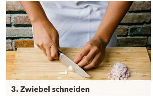
3. Zwiebel schneiden

Das Fleisch trocken tupfen und von beiden Seiten mit der Gulasch-Gewürzmischung und 1 Prise Salz einreiben. Tipp: Wer mag, kann das Fleisch zuvor plattieren.