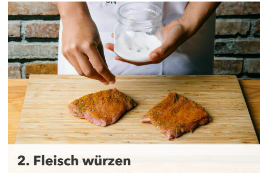
2. Fleisch würzen

Die Süßkartoffeln und die Karotten ggf. schälen und grob würfeln. In einem mittelgroßen Topf mit Wasser bedecken, ½TL Salz hinzugeben, dann zum Kochen bringen. Das Gemüse in 12-15Min. weich garen, dann in ein Sieb abgießen und abtropfen lassen. Zurück in den Topf geben, zu einem glatten Püree stampfen und mit Salz und Pfeffer abschmecken.