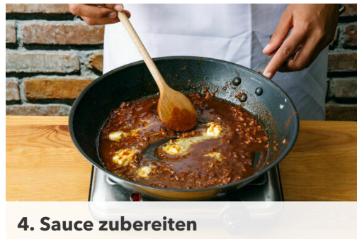
4. Sauce zubereiten

Die Zwiebel schälen, halbieren und fein würfeln. Den Knoblauch schälen und in hauchdünne Scheibchen schneiden.