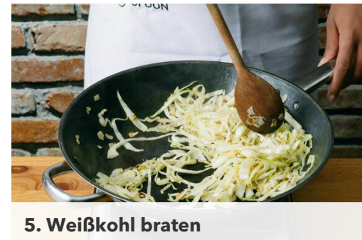
5. Weißkohl braten

Das Fleisch in einer großen Pfanne mit 1EL Olivenöl bei mittlerer Hitze auf jeder Seite ca. 2Min. anbraten, bis das Fleisch durch ist. In ein Stück Alufolie wickeln. Die Zwiebeln und das Paprikapulver ca. 2Min. im Bratfett bei mittlerer Hitze anschwitzen. Mit 2EL Balsamicoessig und 3EL Wasser ablöschen, 2EL Butter unterrühren und mit Zucker, Salz und Pfeffer abschmecken.