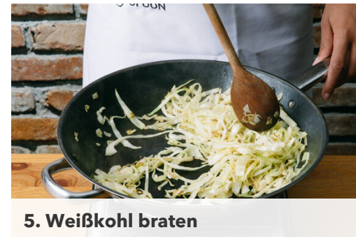
5. Weißkohl braten

Das Fleisch in einer mittelgroßen Pfanne mit 1EL Olivenöl bei mittlerer Hitze auf jeder Seite ca. 2Min. anbraten, bis das Fleisch durch ist. In ein Stück Alufolie wickeln. Die Zwiebeln und das Paprikapulver ca. 2Min. im Bratfett bei mittlerer Hitze anschwitzen. Mit 1EL Balsamicoessig und 2EL Wasser ablöschen, 1EL Butter unterrühren und mit Zucker, Salz und Pfeffer abschmecken.