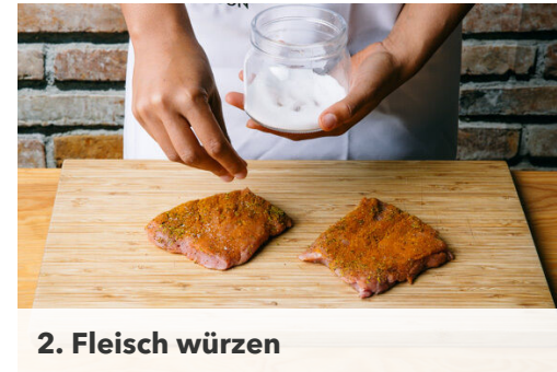
2. Fleisch würzen

Die Süßkartoffeln und die Karotten ggf. schälen und grob würfeln. In einem mittelgroßen Topf mit Wasser bedecken, ½TL Salz hinzugeben, dann zum Kochen bringen. Das Gemüse in 12-15Min. weich garen, dann in ein Sieb abgießen und abtropfen lassen. Zurück in den Topf geben, zu einem glatten Püree stampfen und mit Salz und Pfeffer abschmecken.