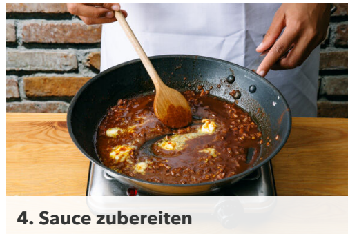
4. Sauce zubereiten

Die Zwiebel schälen, halbieren und fein würfeln. Den Knoblauch schälen und in hauchdünne Scheibchen schneiden.