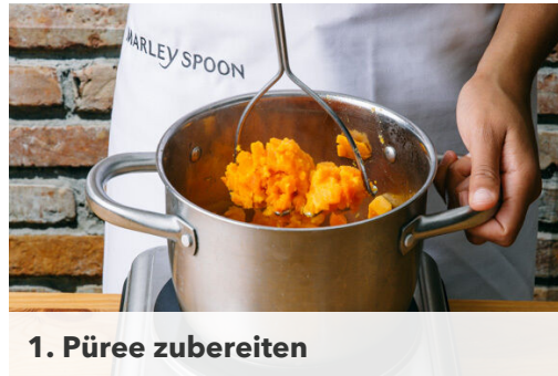
1. Püree zubereiten

Energie 648kcal, Fett 29.4g, Kohlenhydrate 54.8g, Eiweiß 33.5g