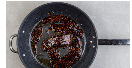
6. Sauce zubereiten

Die Rotkohlstreifen mit 1 kräftigen Prise Salz 2-3Min. durchkneten, bis der Kohl weich wird. Dabei am besten Küchenhandschuhe tragen. Dann die Karotten , den Ingwer , 1EL Pflanzenöl und 2EL hellen Essig untermengen und den Salat mit 1-2EL Sojasauce , ½TL Zucker sowie Salz und Pfeffer nach Geschmack würzen.