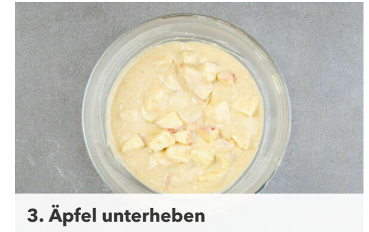
3. Äpfel unterheben

Die Baconstreifen ohne Zugabe von Fett in einer großen Pfanne bei mittlerer bis starker Hitze in 5-7Min. knusprig braten, dabei gelegentlich rühren. Anschließend aus der Pfanne nehmen, auf etwas Küchenkrepp abtropfen lassen und dann in einer Schüssel mit dem Ahornsirup vermengen.