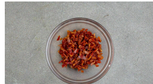
5. Bacon verfeinern

Das Mehl in ein feines Sieb geben und in eine Schüssel sieben, 1TL Backpulver , 130g Zucker und 1 kräftige Prise Salz dazugeben. Dann die weiche Butter und 60ml Milch dazugeben und alles mit einem Handrührgerät vermengen, bis der Teig geschmeidig ist. Tipp: Wer kein Handrührgerät hat, kann auch einen Schneebesen verwenden, das dauert allerdings länger.