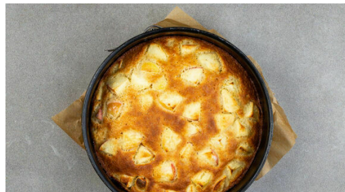
4. Kuchen backen

Den Backofen auf 195°C (175°C Umluft) vorheizen. Eine Springform (Ø20-22cm) mit 1EL Butter fetten oder mit Backpapier auslegen. 60g Butter abwiegen und Raumtemperatur annehmen lassen. 120ml Milch abmessen und beiseitestellen, die übrige Milch wird für dieses Rezept nicht benötigt. Die Äpfel vierteln, entkernen und in 1-2cm große Stücke schneiden.