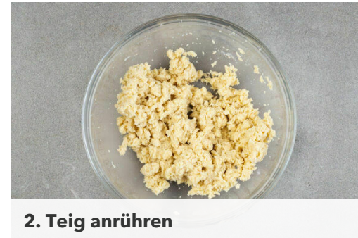
2. Teig anrühren

Den Teig in die Springform gießen und 25-30Min. im Ofen backen, bis der Kuchen durchgebacken ist. Einen Zahnstocher in die Mitte des gebackenen Kuchens stechen: Wenn kein Teig daran kleben bleibt, ist der Kuchen fertig. Tipp: Die Backzeit kann, je nach Größe der Springform, ggf. abweichen.