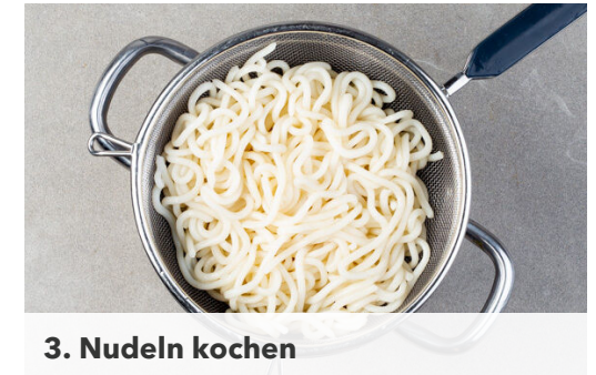
3. Nudeln kochen

2EL hellen Essig, 1EL Zucker und 1 Prise Salz verrühren und mit dem Ingwer vermengen, bis er vollständig mit der Flüssigkeit bedeckt ist.