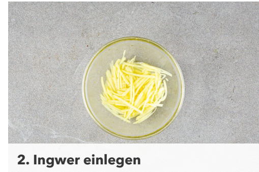
2. Ingwer einlegen

In einem mittelgroßen Topf ausreichend gesalzenes Wasser für die Nudeln zum Kochen bringen. Den Brokkoli in kleine Röschen schneiden. Den Ingwer schälen und in feine Stifte schneiden.