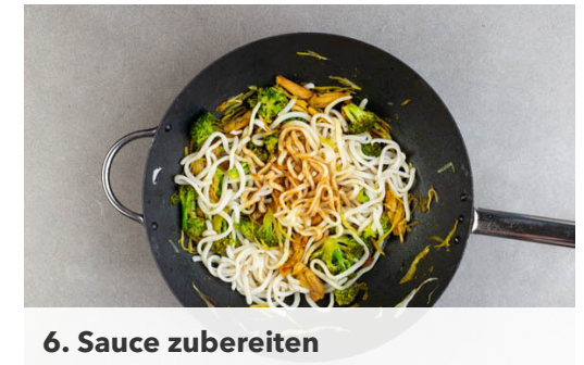
6. Sauce zubereiten

Das Gemüse aus der Pfanne nehmen und beiseitestellen. Das Fleisch in der Pfanne mit 1EL Pflanzenöl bei starker Hitze ca. 3Min. scharf anbraten, dann das Gemüse , ca. ⅔ des Currypulvers oder mehr nach Geschmack sowie die Nudeln dazugeben und ca. 1Min. mitbraten.