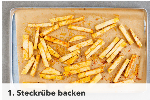
1. Steckrübe backen

Energie 852kcal, Fett 48.7g, Kohlenhydrate 70.3g, Eiweiß 34.0g