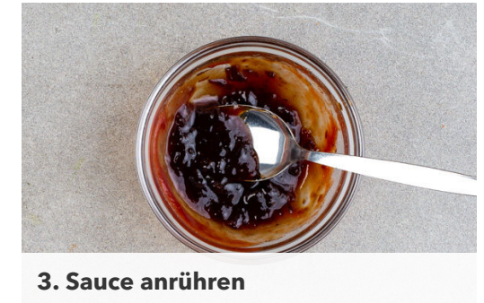
3. Sauce anrühren

Die Pattys in einer mittelgroßen Pfanne mit 1EL Olivenöl bei mittlerer bis starker Hitze auf jeder Seite ca. 3Min. braten, bis das Fleisch durch ist. Die Burgerbrötchen aufschneiden, die Hälften wieder aufeinanderlegen und im Ofen ca. 3Min. aufbacken.