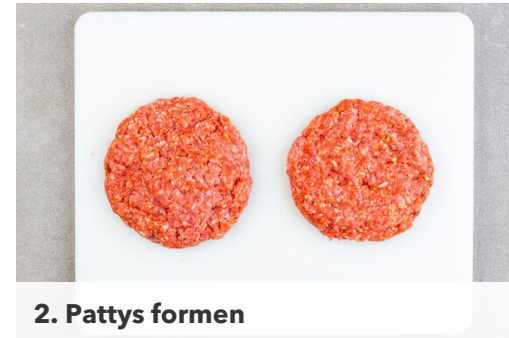
2. Pattys formen

Die Birne längs vierteln, entkernen und der Länge nach in dünne Scheiben schneiden. Mit dem Rucola , 1EL Olivenöl und 1 Prise Salz vermengen.