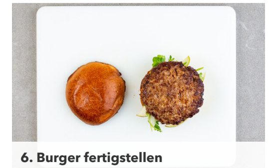
6. Burger fertigstellen

Die Zwiebelmarmelade mit 2EL Tomatenketchup verrühren.