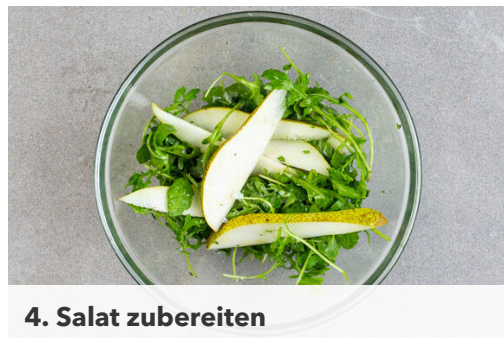
4. Salat zubereiten

Den Backofen auf 240°C (220°C Umluft) vorheizen. Die Steckrübe schälen und erst in ca. 1cm dicke Scheiben, dann in ca. 1cm breite Stifte schneiden. Auf einem mit Backpapier ausgelegten Backblech mit 1EL Olivenöl und der ½ der Gewürzmischung vermengen, dann 20-25Min. im Ofen backen.