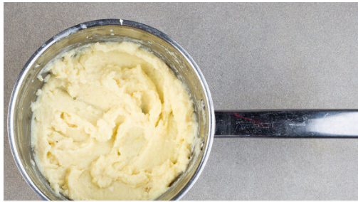
1. Püree zubereiten

Energie 675kcal, Fett 43.7g, Kohlenhydrate 26.4g, Eiweiß 41.9g