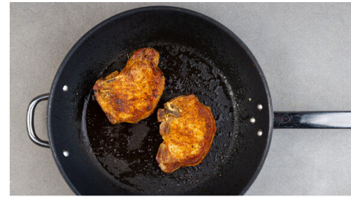
2. Fleisch braten

Die Zwiebeln mit 1EL Mehl bestäuben und erneut ca. 1Min. braten, dann unter ständigem Rühren 400ml Brühe angießen. Die Brühe zum Kochen bringen, anschließend bei mittlerer bis niedriger Hitze 2-3Min. köcheln lassen, bis die Sauce eingedickt ist.