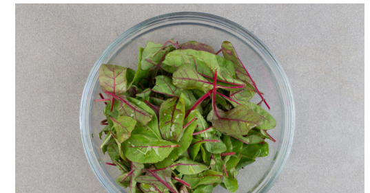
6. Salat anmachen

Die Zwiebeln schälen und halbieren, in dünne Streifen schneiden und in derselben Pfanne mit 2EL Butter bei mittlerer Hitze 5-6Min. anschwitzen, dabei ggf. vorhandenen Bratensatz vom Pfannenboden lösen. Die Zitrone halbieren und auspressen. Das Brühwürz in 500ml heißem Wasser auflösen.