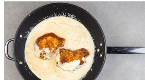
5. Fleisch mitköcheln

Das Fleisch trocken tupfen, mit der Gewürzmischung , 1TL Salz und 1 kräftigen Prise Pfeffer einreiben, dann in einer großen Pfanne mit 2EL Olivenöl bei mittlerer bis starker Hitze jeweils 2-3Min. auf jeder Seite goldbraun anbraten. Auf einem Teller beiseitestellen. Tipp: Ggf. zwei Pfannen verwenden, dann geht es etwas schneller.