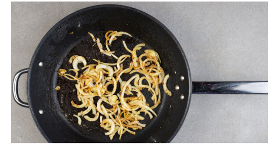
3. Zwiebeln anbraten

Die Hitze reduzieren und 1EL Zitronensaft sowie die Crème fraîche einrühren, dann mit Salz und Pfeffer abschmecken und die Sauce noch 1-2Min. köcheln lassen, bis sie die gewünschte Konsistenz erreicht hat. Das Fleisch in die Sauce legen und bei niedriger Hitze 4-6Min. köcheln, bis das Fleisch gar ist. Ggf. mehr Brühe angießen.