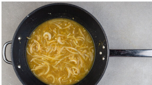
4. Sauce köcheln

Die Pastinaken schälen, in ca. 2cm dicke Scheiben schneiden und in einen kleinen Topf geben. 200ml Milch oder Wasser sowie 1TL Salz hinzugeben und aufkochen, dann abgedeckt bei niedriger Hitze 12-15Min. garen. Die 1/2 des Meerrettichs oder mehr nach Geschmack schälen und fein reiben. Die Pastinaken im Topf mit dem Meerrettich glatt pürieren und mit Salz und Pfeffer abschmecken.