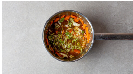
4. Gemüse garen

Währenddessen in einem zweiten kleinen Topf 300ml leicht gesalzenes Wasser zum Kochen bringen. Den Reis in einem Sieb kalt abspülen, bis das Wasser klar bleibt. Sobald das Wasser kocht, den Reis hineingeben und abgedeckt bei niedrigster Hitze 10-12Min. kochen, bis das Wasser aufgesogen und der Reis gar ist. Noch ca. 5Min. ohne Hitzezufuhr ziehen lassen.