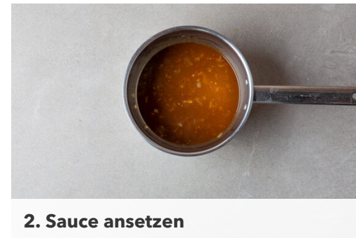
2. Sauce ansetzen

Die Zwiebel und den Knoblauch schälen, halbieren und in feine Würfel schneiden. Die Karotte ggf. schälen, längs halbieren und schräg in dünne Scheiben schneiden. Die Lauchzwiebel in feine Ringe schneiden.