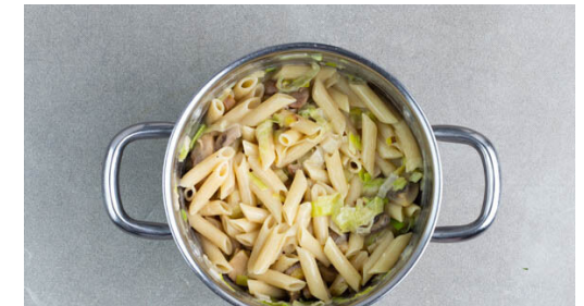
6. Pasta fertigstellen

Das Fleisch trocken tupfen, in 3-4cm große Stücke schneiden und mit je 1 Prise Salz und Pfeffer würzen.