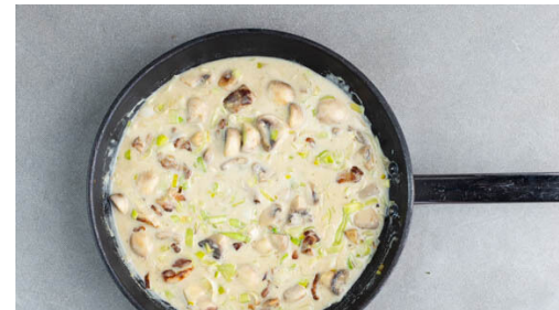
5. Sauce kochen

Die Baconstreifen in einer mittelgroßen Pfanne mit 1TL Olivenöl bei starker Hitze 2-3Min. knusprig anbraten. Anschließend auf etwas Küchenkrepp abtropfen lassen, die Pfanne aufbewahren. Die Pfanne nicht auswischen.