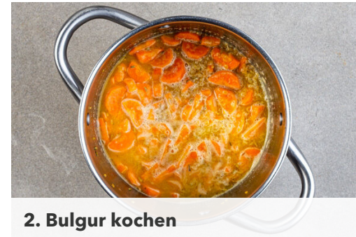
2. Bulgur kochen

Die übrige Gewürzmischung mit 2EL Olivenöl und 1 kräftigen Prise Salz verrühren. Das Fleisch trocken tupfen, mit dem Würzöl einreiben und in einer großen Pfanne bei starker Hitze auf jeder Seite 2-3Min. braten, abhängig davon, ob es medium oder eher durchgebraten sein soll. Aus der Pfanne nehmen und bis zum Servieren auf einem Teller abgedeckt ruhen lassen.