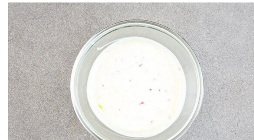
5. Dip zubereiten

Die Karotten in den Topf zu den Fenchelsamen geben und in 5-7Min. weich braten, dabei gelegentlich umrühren. Den Bulgur mit dem Brühgewürz und 600ml Wasser einrühren, zum Kochen bringen und abgedeckt bei niedriger Hitze 8-10Min. sanft köcheln lassen, bis das Wasser aufgesaugt und der Bulgur gar ist.