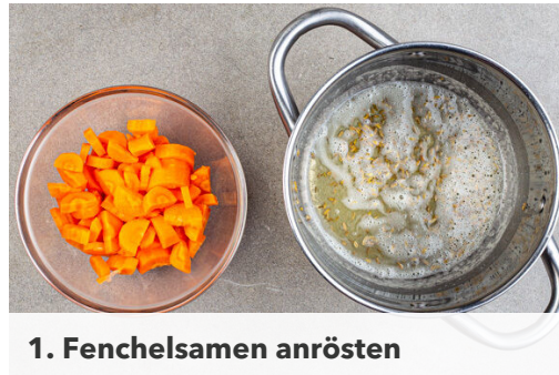
1. Fenchelsamen anrösten

Energie 798kcal, Fett 37.6g, Kohlenhydrate 64.2g, Eiweiß 44.1g