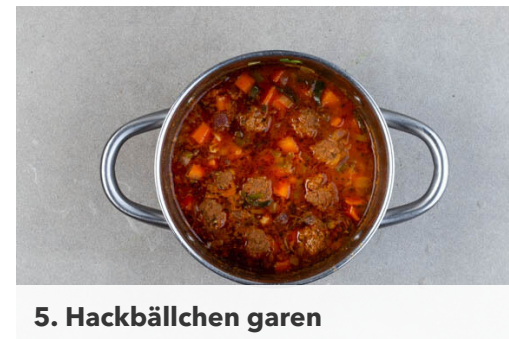
5. Hackbällchen garen

Die ½ des Tomatenmarks zum Gemüse in den Topf geben und kurz mitbraten, dann mit 600ml heißem Wasser ablöschen. Das Brühgewürz sowie ½-1TL Salz unterrühren und den Eintopf bei niedrigster Hitze 3-4Min. sanft köcheln lassen.