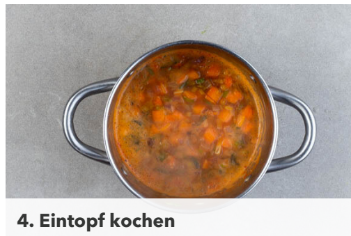
4. Eintopf kochen

In einem großen Topf 1EL Pflanzenöl bei starker Hitze erwärmen. Den Lauch , die Zwiebeln , die Karotten und die Knoblauchscheibchen in das heiße Öl geben, mit 1EL Mehl bestäuben und 2-3Min. scharf anbraten, bis leichte Röstspuren zu sehen sind.