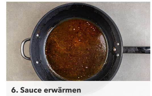
6. Sauce erwärmen

Das Fleisch trocken tupfen, mit Salz und Pfeffer würzen und in derselben Pfanne mit 1EL Pflanzenöl bei starker Hitze auf der Fettseite 2-4Min. scharf anbraten. Wenden und weitere 2-4Min. braten, je nach Dicke des Fleisches . Die Hitze reduzieren und das Fleisch 1-3Min. abgedeckt garen, je nachdem, ob es medium oder durch sein soll. Abgedeckt auf einem Teller ruhen lassen.