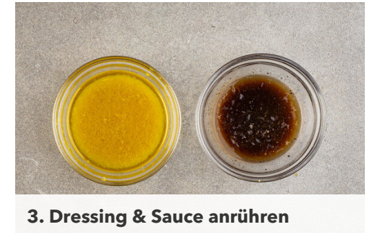
3. Dressing & Sauce anrühren

Den Blumenkohl , die Zwiebeln und den Knoblauch mit 1EL Sojasauce sowie je 1 Prise Salz und Pfeffer vermengen und auf einem mit Backpapier ausgelegten Backblech verteilen. 1EL Butter in kleine Würfel schneiden und auf dem Gemüse verteilen. Das Gemüse 12-15Min. im Ofen rösten. Nach der Hälfte der Zeit wenden.