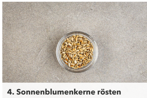
4. Sonnenblumenkerne rösten

Die Zitronenschale abreiben, dann die Zitrone halbieren und auspressen. Die 1/2 des Zitronensafts mit 2TL Sojasauce und 1 Prise Pfeffer zu einer Sauce verrühren. Den restlichen Zitronensaft mit 1EL Wasser, 1EL Pflanzenöl, 1TL Senf, 1TL Honig und 1 Prise Zitronenschale zu einem Dressing verrühren. Mit Salz und Pfeffer abschmecken.