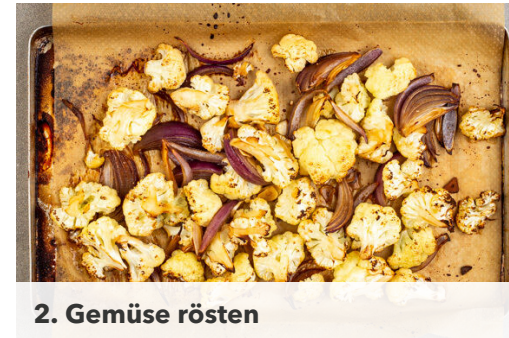
2. Gemüse rösten

Den Backofen auf 240°C (220°C Umluft) vorheizen. Den Blumenkohl in mundgerechte Röschen schneiden. Die Zwiebel schälen, halbieren und in dünne Spalten schneiden. Den Knoblauch schälen und in feine Scheibchen schneiden.