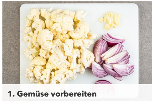
1. Gemüse vorbereiten

Energie 610kcal, Fett 42.8g, Kohlenhydrate 17.6g, Eiweiß 37.0g