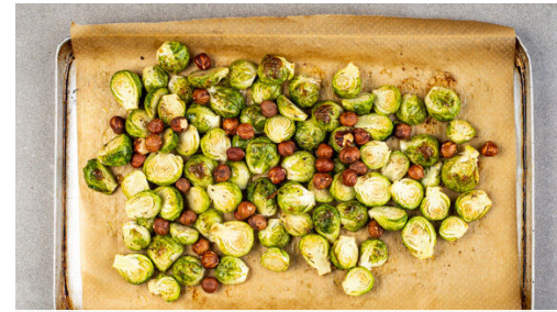
2. Rosenkohl backen

In einer großen Pfanne 2EL Olivenöl stark erhitzen, darin die Zwiebeln mit 2TL Zucker und 1TL Salz 5-6Min. anbräunen. 2TL Mehl unterrühren, mit 500ml Wasser ablöschen und die Sauce bei mittlerer Hitze 3-4Min. einköcheln lassen. Tipp: Für noch mehr Geschmack 200ml Rotwein und 300ml Wasser verwenden.