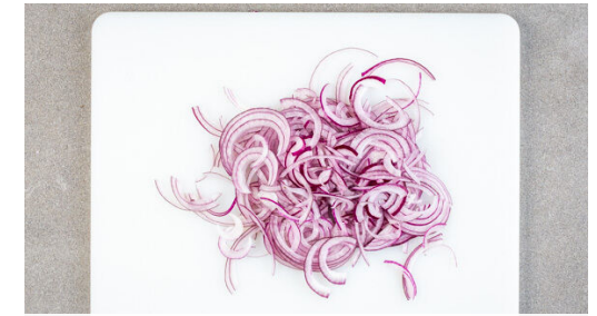
3. Zwiebeln schneiden

Die Würste in einer zweiten Pfanne mit 1EL Olivenöl bei starker Hitze auf jeder Seite ca. 1Min. knusprig anbraten. Die Hitze reduzieren und die Würste weitere 4-5Min. auf jeder Seite braten, bis sie gar sind.