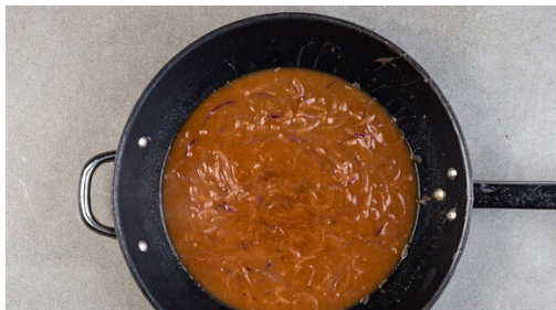
4. Sauce zubereiten

Den Backofen auf 230°C (210°C Umluft) vorheizen. Die Pastinaken und die Kartoffeln schälen, grob würfeln und in einem mittelgroßen Topf mit Wasser bedecken. 1TL Salz zugeben, abgedeckt zum Kochen bringen und bei mittlerer Hitze in 12-13Min. gar köcheln lassen. In ein Sieb abgießen und abtropfen lassen, dann in den Topf zurückgeben und abgedeckt warm halten.