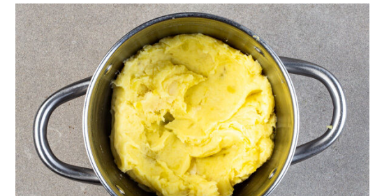
6. Püree stampfen

Die Zwiebeln schälen, halbieren und in feine Streifen schneiden.