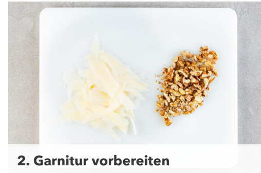
2. Garnitur vorbereiten

Die Baconstreifen in der Pfanne mit 1EL Olivenöl bei starker Hitze 3-4Min. kross anbraten, dann auf etwas Küchenkrepp abtropfen lassen. Die Pfanne nicht auswischen.