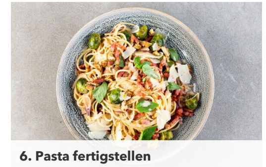
6. Pasta fertigstellen

Die Pasta in das kochende Wasser geben und in 8-10Min. bissfest kochen. Mit einem Messbecher ca. 300ml Pastawasser abschöpfen, dann die Pasta in ein Sieb abgießen und abtropfen lassen.