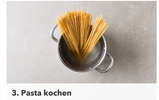
3. Pasta kochen

Den Rosenkohl und die Zwiebeln in derselben Pfanne mit 2EL Butter bei mittlerer Hitze 3-4Min. anbraten. Den Knoblauch unterrühren und mit Pfeffer würzen, dann mit dem Pastawasser ablöschen und den Rosenkohl ca. 4Min. weiter garen, bis er weich ist.