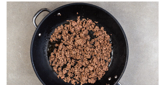
3. Hackfleisch braten

Die Paprika vierteln, entkernen und in ca. 0,5cm kleine Würfel schneiden. Die Petersilie samt Stängeln fein hacken.