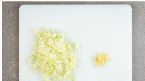
1. Zwiebel schneiden

Energie 1010kcal, Fett 70.2g, Kohlenhydrate 55.5g, Eiweiß 34.2g