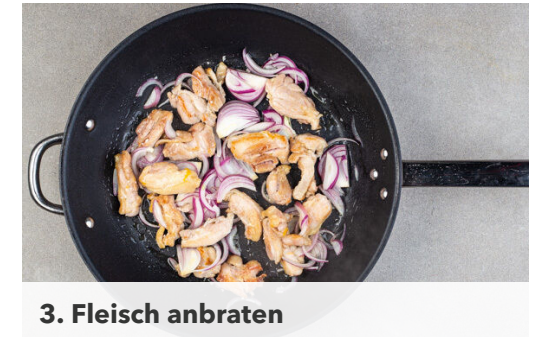
3. Fleisch anbraten

Die Limettenschalen fein abreiben und jede Limette in 6 Spalten schneiden. Die Chilischoten längs halbieren und in hauchdünne Streifen schneiden. Tipp: Für weniger Schärfe die Kerne entfernen. Die Thai-Basilikumblätter von den Stängeln zupfen.