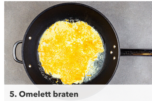
5. Omelett braten

Die Tomaten in kleine Würfel schneiden, in die Pfanne zu dem Gemüse geben und bei mittlerer Hitze 1-2Min. erwärmen. Das Gemüse und den Bacon aus der Pfanne nehmen und die Pfanne auswaschen.