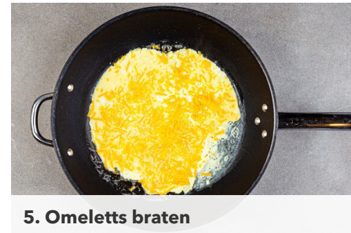
5. Omeletts braten

Die Tomaten in kleine Würfel schneiden, in die Pfanne zu dem Gemüse geben und bei mittlerer Hitze 1-2Min. erwärmen. Das Gemüse und den Bacon aus der Pfanne nehmen und die Pfanne auswaschen.