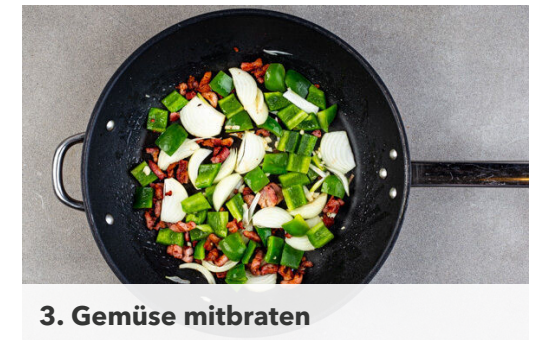
3. Gemüse mitbraten

Die Paprika vierteln, entkernen und in ca. 2cm große Stücke schneiden. Die Zwiebeln schälen, halbieren und in dünne Streifen schneiden. Den Knoblauch schälen und fein würfeln.