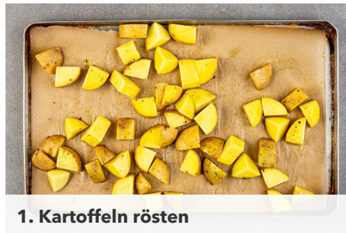
1. Kartoffeln rösten

Energie 746kcal, Fett 44.5g, Kohlenhydrate 54.0g, Eiweiß 30.5g