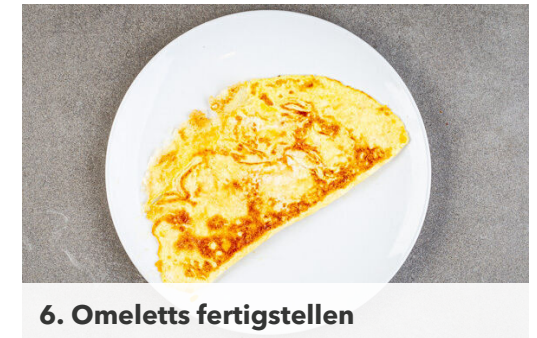
6. Omeletts fertigstellen

Die Eier mit 4EL Milch sowie je 1 kräftigen Prise Salz und Pfeffer gut verquirlen. Jeweils 1EL Butter in derselben und einer weiteren großen Pfanne bei mittlerer bis starker Hitze erwärmen. Jeweils ¼ der Eiemischung hineingießen, dabei die Pfannen leicht schwenken, um gleichmäßige Omeletts zu erhalten. Mit jeweils ¼ des Käses bestreuen und abgedeckt in 1-2Min. gar braten.