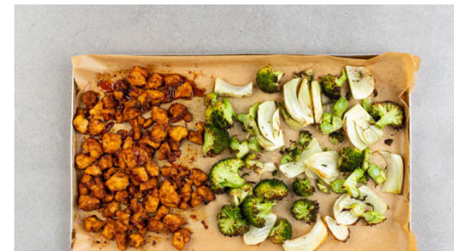
5. Gemüse und Tofu wenden

Den Brokkoli und die Fenchelspalten auf einem mit Backpapier ausgelegten Backblech mit 2EL Olivenöl sowie je 1 Prise Salz und Pfeffer vermengen. Die Sojasauce mit der ½ des Paprikapulvers , 1TL Mehl und 1EL Olivenöl verrühren. Den Tofu zerkrümeln und mit dem Würzöl vermengen. Dann ebenfalls auf das Backblech geben und alles ca. 12Min. im Ofen backen.