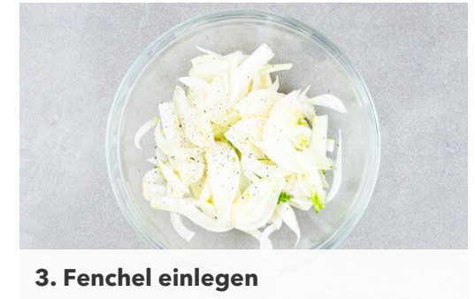
3. Fenchel einlegen

Nach ca. 12Min. Backzeit das Gemüse auf dem Backblech wenden. Den Tofu mit 2TL Honig vermengen und alles weitere 5-8Min. backen, bis der Brokkoli an den Rändern knusprig wird und der Tofu appetitlich gebräunt ist.