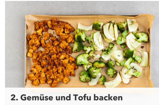
2. Gemüse und Tofu backen

Die Walnüsse mit den Fingern in kleine Stücke brechen und in einer kleinen Pfanne ohne Zugabe von Fett bei mittlerer Hitze 1-2Min. anrösten. Vorsicht , sie können schnell zu dunkel werden. Den Apfel halbieren und in ca. 1cm große Würfel schneiden, dabei das Kerngehäuse entfernen. Den Knoblauch schälen und fein würfeln. Den Käse mit einem Sparschäler in feine Streifen hobeln.