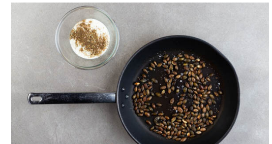
3. Dip anrühren

Die Zwiebel schälen, halbieren und in dünne Spalten schneiden. Den Knoblauch schälen und in feine Scheibchen schneiden. Die Zwiebeln und den Knoblauch in der Pfanne mit dem Bratensaft und je 1 Prise Salz und Pfeffer bei mittlerer Hitze in 3-4Min goldbraun anbraten.