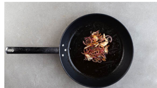
5. Zwiebeln braten

Den Blumenkohl und die Zitronenstreifen auf einem mit Backpapier ausgelegten Backblech mit 1EL Olivenöl sowie je 1 kräftigen Prise Salz und Pfeffer vermengen. Im Ofen 25-30Min. rösten, bis der Blumenkohl appetitlich gebräunt ist.