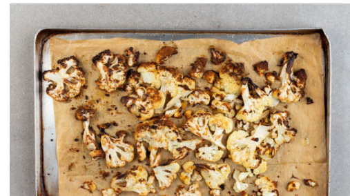
2. Blumenkohl rösten

Das Fleisch trocken tupfen und mit Salz und Pfeffer würzen. In der Pfanne mit 1EL Olivenöl bei starker Hitze auf der Fettseite 2-4Min. scharf anbraten, wenden und je nach Dicke weitere 2-4Min. braten. Die Hitze reduzieren, das Fleisch 1-3Min. abgedeckt garen, je nachdem, ob es medium oder durch sein soll. Abgedeckt auf einem Teller ruhen lassen. Die Pfanne samt Bratensaft aufbewahren.