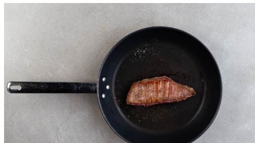
4. Fleisch braten

Den Backofen auf 240°C (220°C Umluft) vorheizen. Das Fleisch aus dem Kühlschrank nehmen und Raumtemperatur annehmen lassen. Den Blumenkohl in mundgerechte Röschen schneiden. Die ½ der Zitronenschale abreiben, dann die Zitrone halbieren und eine Hälfte auspressen, die andere Hälfte in feine Streifen schneiden.