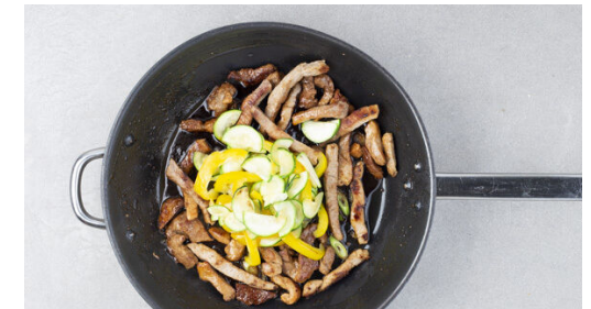
6. Gemüse untermengen

Die Lauchzwiebeln schräg in feine Ringe schneiden, den weißen und grünen Teil getrennt aufbewahren.