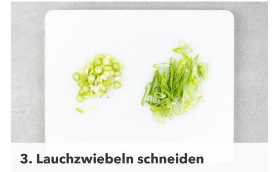
3. Lauchzwiebeln schneiden

Das Fleisch trocken tupfen, in ca. 1cm dünne Streifen schneiden und in der Pfanne mit 2EL Pflanzenöl bei starker Hitze ca. 1Min. rundum scharf anbraten. Die weißen Lauchzwiebelringe dazugeben und kurz mitbraten, dann die Sojasauce und 2EL Honig unterrühren, kräftig mit Pfeffer würzen und 1-2Min. weiter braten.