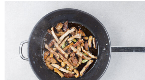
5. Fleisch anbraten

Die Zucchini der Länge nach halbieren und in dünne Scheiben schneiden. Die Paprika vierteln, entkernen und in dünne Streifen schneiden.