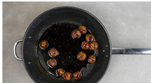
4. Hackbällchen braten

Das Hackfleisch mit dem Knoblauch , dem Ingwer und dem restlichen Sesam vermengen und gut durchkneten. Mit feuchten Händen etwa walnussgroße Bällchen formen.