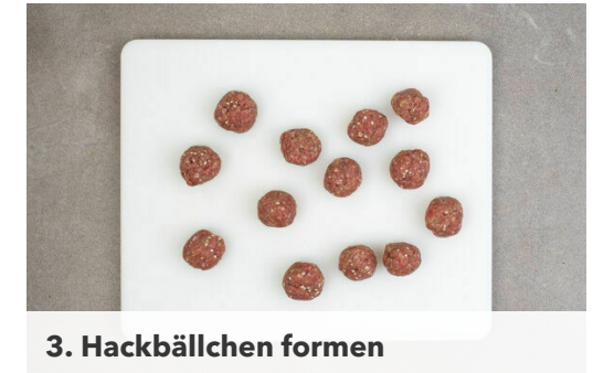
3. Hackbällchen formen

Ca. ⅔ des Sesamöls mit 1TL Sesam , 2EL hellem Essig, ½TL Zucker und je 1 kräftigen Prise Salz und Pfeffer zu einer Marinade verrühren. Die Karotten ggf. schälen und grob reiben oder in sehr feine Stifte schneiden. Die Karotten mit der Marinade vermengen.