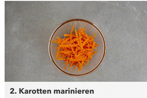
2. Karotten marinieren

In einem großen Topf ausreichend gesalzenes Wasser für die Nudeln zum Kochen bringen. Den Knoblauch schälen und fein würfeln. Die ½ des Ingwers schälen und fein reiben. Tipp: Wer mag, kann auch mehr Ingwer verwenden oder nutzt den restlichen Ingwer zum Aufbrühen eines Tees. Die Lauchzwiebeln schräg in feine Ringe schneiden.