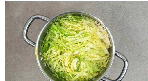
5. Nudeln und Kohl garen

Die Hackbällchen in einer großen Pfanne mit 2EL Pflanzenöl bei mittlerer Hitze 5-8Min. rundum braten, bis sie goldbraun und fast gar sind. Die Teriyakisauce dazugeben und unter Rühren kurz eindicken lassen, bis alle Hackbällchen mit einer sämigen Sauce bedeckt und gar sind. Mit Salz und Pfeffer abschmecken und bis zum Servieren warm halten.