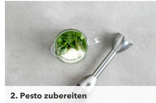
2. Pesto zubereiten

Die Rouladen in einer großen Pfanne mit 2EL Olivenöl bei starker Hitze ca. 2Min. rundum scharf anbraten. Die Rouladen anschließend aus der Pfanne nehmen, in eine Auflaufform geben und im Ofen ca. 8Min. garen, bis das Fleisch gar ist. Die Pfanne aufbewahren.