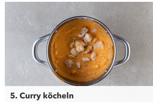
5. Curry köcheln

Das Fleisch trocken tupfen, in mundgerechte Stücke schneiden und in einem mittelgroßen Topf mit 1EL Butter oder Pflanzenöl, 1 kräftigen Prise Salz und 1 Prise Pfeffer bei mittlerer Hitze in ca. 3Min. goldbraun anbraten, das Fleisch muss noch nicht gar sein. Das Fleisch aus dem Topf nehmen und auf einem Teller beiseitestellen.