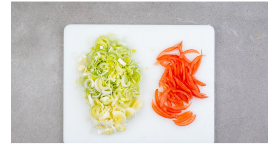
3. Gemüse schneiden

Das Panko-Paniermehl auf einen flachen Teller geben und das Fleisch nacheinander darin wenden, sodass es von allen Seiten gut bedeckt ist.