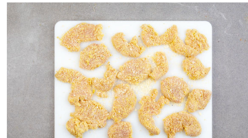
5. Nuggets panieren

Das Fleisch trocken tupfen, in mundgerechte Stücke schneiden und mit 1,5EL körnigem Senf vermengen. Den Käse fein reiben.