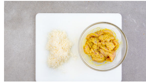
2. Fleisch vorbereiten

Den Lauch in einem weiteren mittelgroßen Topf mit 1EL Butter bei mittlerer Hitze ca. 2Min. farblos anschwitzen. Mit 250ml Wasser ablöschen, das Brühwürz einstreuen und alles ca. 3Min. sanft köcheln lassen. Die Crème fraîche unterrühren, die Sauce einmal aufkochen lassen, dann die ½ des Käses untermischen. Mit Salz und Pfeffer abschmecken.