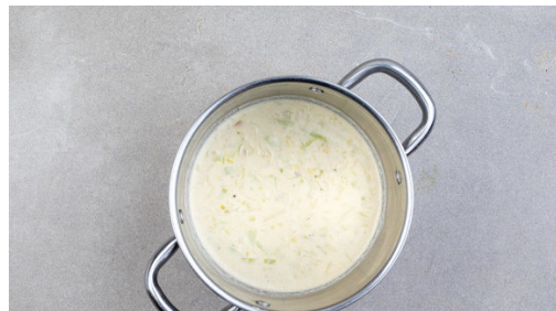
4. Sauce zubereiten

In einem mittelgroßen Topf ausreichend gesalzenes Wasser für die Pasta zum Kochen bringen. Die Pasta in das kochende Wasser geben und in 8-10Min. bissfest kochen. In ein Sieb abgießen und abtropfen lassen.