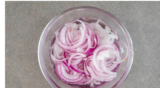
2. Zwiebeln einlegen

Die Karotten ggf. schälen und grob raspeln. Den Knoblauch schälen und fein reiben. Die Zwiebeln schälen, halbieren und in feine Streifen schneiden. Die Karotten mit dem Knoblauch , 2EL Mayonnaise, 1EL Essig und je 1 kräftigen Prise Salz und Pfeffer vermengen.