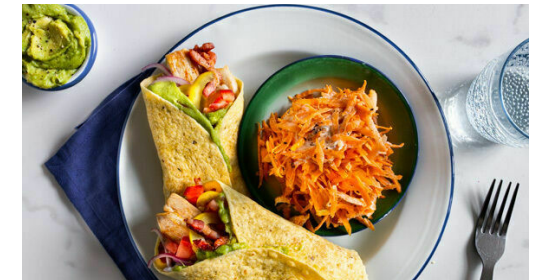
6. Tortillas erwärmen

Inzwischen die Tomaten in kleine Würfel schneiden. Die Paprika vierteln, entkernen und in dünne Streifen schneiden.