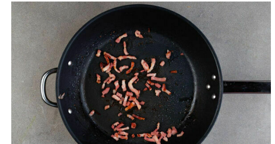
3. Bacon braten

1½TL Zucker, ½-1TL Salz, 70ml hellen Essig und 70ml warmes Wasser verrühren, bis sich Salz und Zucker aufgelöst haben, dann die Zwiebeln untermengen und beiseitestellen.