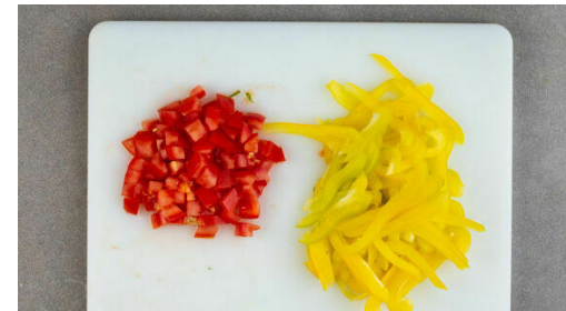
5. Gemüse schneiden

Das Fleisch trocken tupfen, in dünne Streifen schneiden und mit je 1 Prise Salz und Pfeffer würzen, dann in die Pfanne zu dem Bacon geben und 4-5Min. unter gelegentlichem Rühren mitbraten, bis das Fleisch gar und der Bacon kross ist.