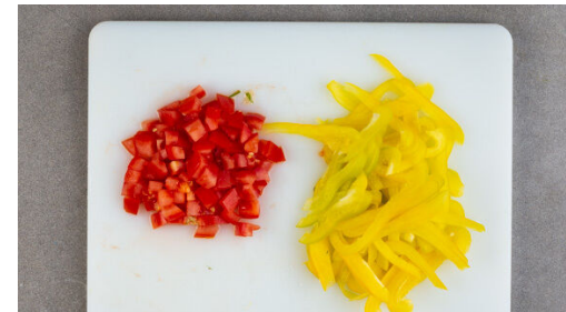
5. Gemüse schneiden

Das Fleisch trocken tupfen, in dünne Streifen schneiden und mit je 1 Prise Salz und Pfeffer würzen, dann in die Pfanne zu dem Bacon geben und 4-5Min. unter gelegentlichem Rühren mitbraten, bis das Fleisch gar und der Bacon kross ist.