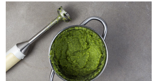
6. Brokkoli pürieren

Die Rosmarinnadeln abstreifen und fein hacken. Den Knoblauch schälen und grob würfeln und mit dem Rosmarin und 1EL Olivenöl verrühren. Die Kartoffeln nach ca. 15Min. Backzeit mit dem Würzöl beträufeln, die Kartoffeln wenden und dabei das Würzöl untermengen. Dann die Kartoffeln fertig backen.