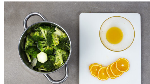
2. Brokkoli kochen

Verzichte auf gedruckte Rezepte – ändere die Einstellungen im Kundenkonto. Fragen zur Zubereitung oder zum Rezept? Deine Koch-Hotline: 030 208 480 510