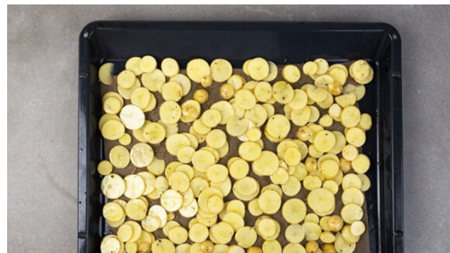
1. Kartoffeln rösten

Energie 742kcal, Fett 43.0g, Kohlenhydrate 52.3g, Eiweiß 34.1g