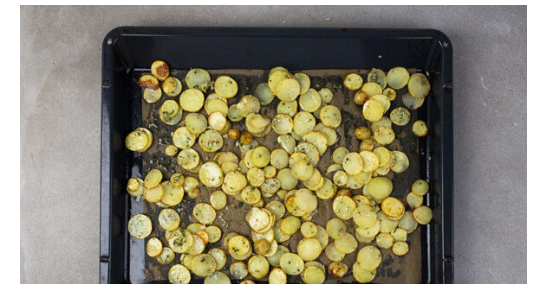
3. Kartoffeln würzen

In der Pfanne den Orangensaft mit 3EL Wasser, 1EL Butter, 1EL Honig oder Zucker sowie je 1 Prise Salz und Pfeffer bei mittlerer Hitze langsam aufkochen. Die Sauce unter Rühren 1-2Min. leicht dicklich einköcheln lassen und mit Salz, Pfeffer und Zucker oder Honig abschmecken.