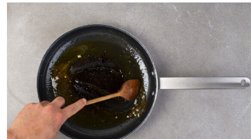
5. Orangensauce zubereiten

Den Brokkoli in mundgerechte Röschen, den Strunk in dünne Scheiben schneiden. Ins kochende Wasser geben und abgedeckt in 8-10Min. bissfest kochen. Ca. 1 Tasse Kochwasser abschöpfen, dann den fertigen Brokkoli in ein Sieb abgießen und abtropfen lassen. Die Orange halbieren, eine Hälfte in dünne Scheiben schneiden, die andere Hälfte auspressen.