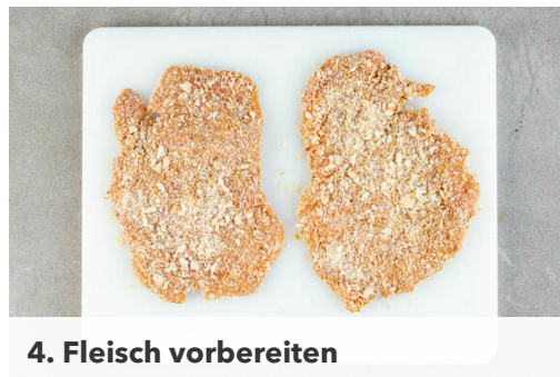
4. Fleisch vorbereiten

Den Backofen auf 240°C (220°C Umluft) vorheizen. Die Kartoffeln samt Schale in einem großen Topf mit leicht gesalzenem Wasser bedecken und zum Kochen bringen, dann ca. 12Min. kochen lassen.