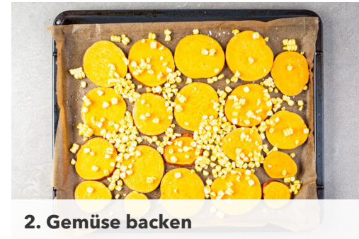
2. Gemüse backen

Den Backofen auf 220°C (200°C Umluft) vorheizen. Die Süßkartoffel samt Schale in ca. 0,5cm dicke Scheiben schneiden. Die Hüllblätter und Fäden entfernen und die Maiskörner mit einem scharfen Messer vom Kolben schneiden.