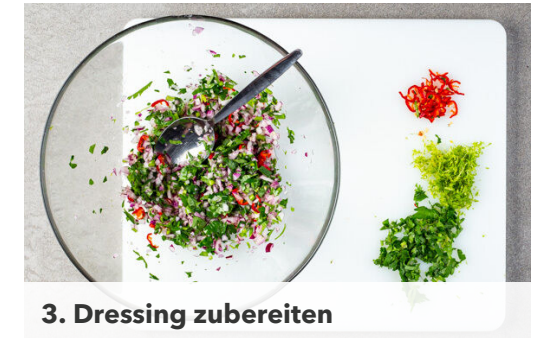
3. Dressing zubereiten

Die Süßkartoffeln und den Mais mit 1EL Pflanzenöl und je ½TL Salz und Pfeffer auf einem mit Backpapier ausgelegten Backblech vermengen und gleichmäßig verteilt in 16-20Min. im Ofen goldbraun backen.