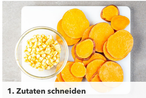
1. Zutaten schneiden

Energie 525kcal, Fett 23.1g, Kohlenhydrate 59.3g, Eiweiß 21.0g