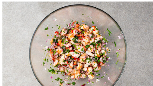
4. Garnelen vorbereiten

Die Zwiebel schälen, halbieren und fein würfeln. Die Schale einer Limette fein abreiben, dann beide Limetten halbieren und auspressen. Den Koriander samt Stängeln fein schneiden. Die Peperoni längs halbieren und in hauchdünne Streifen schneiden. Die Zwiebeln mit der ½ des Limettensafts , der ½ der Peperoni , ⅔ des Korianders und 1/2TL Salz vermengen.