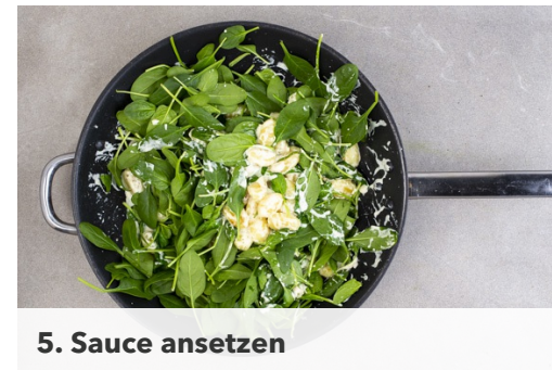
5. Sauce ansetzen

Den Käse fein reiben. Das Brühgewürz in 400ml heißem Wasser auflösen.