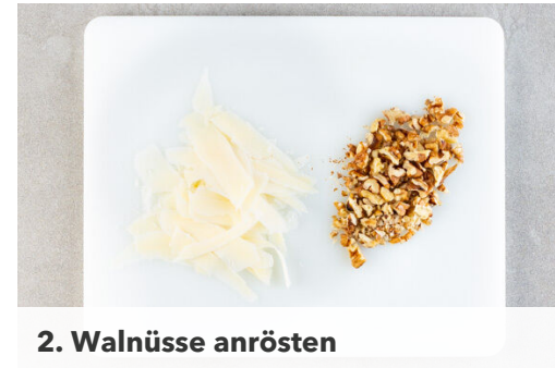
2. Walnüsse anrösten

Den Bacon in der Pfanne mit 1EL Olivenöl bei starker Hitze 3-4Min. kross anbraten, dann auf etwas Küchenkrepp abtropfen lassen. Die Pfanne nicht auswaschen.