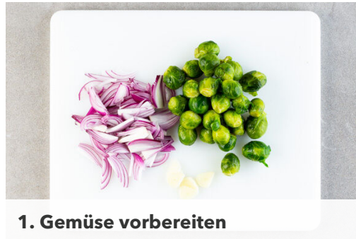
1. Gemüse vorbereiten

Energie 1172kcal, Fett 58.6g, Kohlenhydrate 116.2g, Eiweiß 45.1g