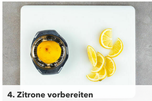
4. Zitrone vorbereiten

Die Zwiebeln , die Karotten und die Paprika in den Topf geben und bei mittlerer bis starker Hitze ca. 3Min. braten.