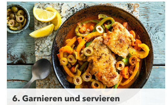
6. Garnieren und servieren

Die Tajine-Paste , die ½ des Brühgewürzes , den Zitronensaft und 300ml heißes Wasser unter das Gemüse rühren. Das Fleisch auf dem Gemüse platzieren und alles abgedeckt 13-15Min. köcheln lassen, bis das Fleisch gar ist. Mit Salz und Pfeffer sowie ggf. mehr Brühgewürz abschmecken.