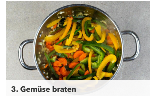
3. Gemüse braten

Das Fleisch trocken tupfen und rundum mit 1 kräftigen Prise Salz würzen. Dann in einem großen Topf mit 3EL Olivenöl bei mittlerer bis starker Hitze auf jeder Seite ca. 2Min. leicht anbräunen, aber noch nicht durchbraten. Aus dem Topf nehmen und auf einem Teller beiseitestellen.