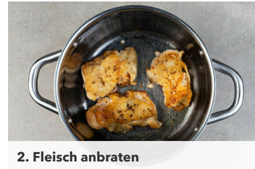
2. Fleisch anbraten

Die Paprika vierteln, entkernen und in ca. 1cm breite Streifen schneiden. Die Karotten ggf. schälen, längs halbieren und in ca. 1cm dicke Scheiben schneiden. Die Zwiebel schälen, halbieren und grob würfeln.