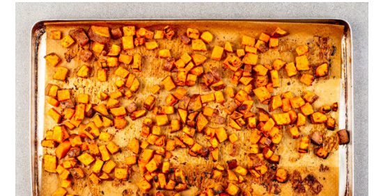
3. Süßkartoffeln backen

Das Fleisch trocken tupfen und rundum mit je 1 kräftigen Prise Salz und Pfeffer würzen. In der Pfanne mit 1EL Pflanzenöl bei starker Hitze auf jeder Seite 2-3Min. braten, abhängig davon, ob es medium oder eher durchgebraten sein soll. Aus der Pfanne nehmen und bis zum Servieren auf einem Teller abgedeckt ruhen lassen.