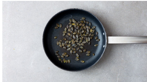
1. Kürbiskerne anrösten

Energie 674kcal, Fett 42.6g, Kohlenhydrate 29.9g, Eiweiß 42.0g