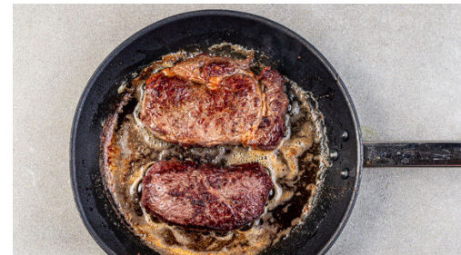
5. Fleisch braten

Die Süßkartoffel samt Schale in ca. 1cm große Würfel schneiden. 1EL Mehl mit 4TL Wasser zu einer dickflüssigen Paste verrühren und mit den Süßkartoffeln vermengen. 2EL Pflanzenöl und je 1 kräftige Prise Salz und Pfeffer unterrühren.