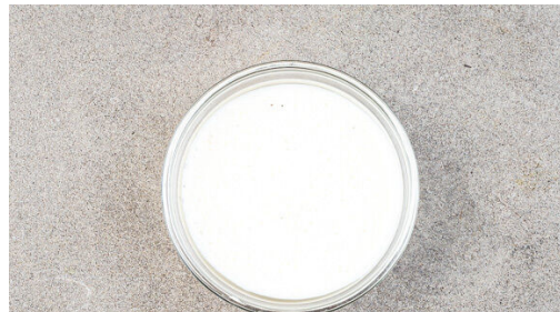
4. Dressing pürieren

Den Backofen auf 240°C (220°C Umluft) vorheizen. Die Kürbiskerne in einer mittelgroßen Pfanne ohne Zugabe von Fett bei mittlerer Hitze 2-4Min. anrösten, bis sie knistern und goldbraun sind. Zum Abkühlen aus der Pfanne nehmen.