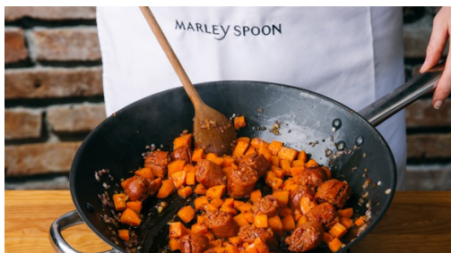
4. Chorizo anbraten

In einem mittleren Topf ausreichend gesalzenes Wasser für die Pasta aufsetzen. Inzwischen die Zwiebel und den Knoblauch schälen, halbieren und in feine Würfel schneiden. Die Karotten schälen, längs vierteln und in ca. 1-2cm große Würfel schneiden.