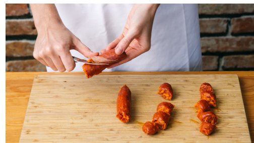
2. Chorizo schneiden

In der Zwischenzeit in einer großen Pfanne 1-2EL Olivenöl erwärmen und die Chorizo mit den Zwiebeln , Knoblauch und den Karottenwürfel ca. 2-3Min. scharf anbraten.