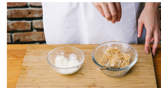
6. Pangrattato rösten

Sobald das Wasser kocht, die Pasta ca. 12-14Min. bissfest kochen, dann abgießen und kalt abschrecken.