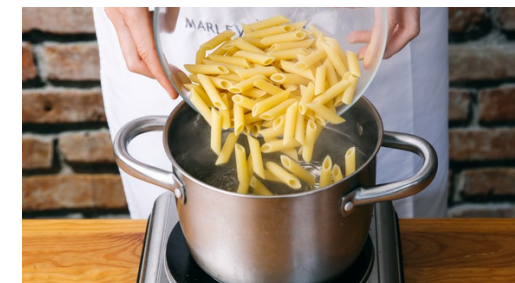
3. Pasta kochen

Die Chorizo mit den gehackten Tomaten ablöschen und einmal aufkochen lassen. Mit Salz, Pfeffer und dem Gewürz abschmecken und zugedeckt ca. 12-14Min, köcheln lassen, bis die Karotten gar sind.