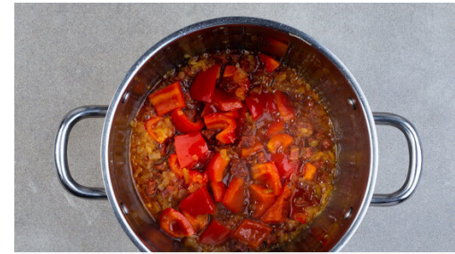
2. Gemüse und Wurst braten

Die Paprika vierteln, entkernen und in grobe Würfel schneiden. Die Zwiebel und den Knoblauch schälen, halbieren und fein würfeln. Die Chorizo ebenfalls in kleine Würfel schneiden.