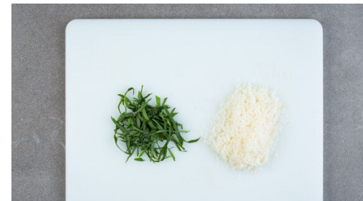
5. Garnitur vorbereiten

Die Kirschtomaten halbieren und mit 1EL Balsamicoessig in den Topf geben. Die Suppe bei mittlerer bis starker Hitze 6-8Min. kochen, dabei gelegentlich umrühren.