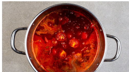
4. Suppe kochen

Das Gemüse mit den passierten Tomaten sowie 200ml warmem Wasser ablöschen, das Brühgewürz einrühren und die Suppe zum Kochen bringen.