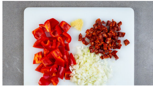
1. Zutaten schneiden

Energie 832kcal, Fett 26.3g, Kohlenhydrate 114.2g, Eiweiß 29.4g