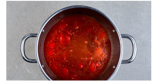
3. Suppe ansetzen

Die Paprika , die Zwiebeln , den Knoblauch und die Chorizo in einem mittelgroßen Topf mit 2TL Olivenöl bei mittlerer Hitze 2-3Min. anbraten, bis das Gemüse weich wird.