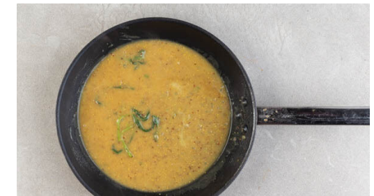
6. Sauce zubereiten

Das Blech mit der Muffin-Backform vorsichtig aus dem Ofen nehmen und die 6 vorbereiteten Mulden jeweils etwa zur Hälfte bzw. bis zu zwei Dritteln mit dem Teig befüllen. Auf der untersten Schiene 20-25Min. backen, bis die Yorkshirepuddings aufgegangen, goldbraun und in der Mitte nicht mehr feucht sind.