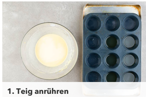
1. Teig anrühren

Energie 795kcal, Fett 40.3g, Kohlenhydrate 63.4g, Eiweiß 47.1g