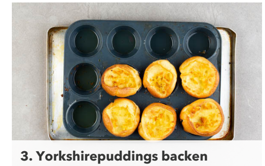
3. Yorkshirepuddings backen

Eine mittelgroße Pfanne bis zum Rauchpunkt erhitzen und 1EL Pflanzenöl hineingeben. Das Fleisch und auf jeder Seite 1-2Min. anbraten. Herausnehmen und in eine mittelgroße Auflaufform geben und 5-7Min. im Ofen fertig garen. Die Hitze reduzieren und die Zwiebeln und den Salbei in der Pfanne mit 1EL Pflanzenöl bei mittlerer Hitze 3-4Min. anschwitzen.