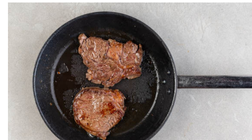
5. Fleisch garen

Die Zwiebel schälen und fein würfeln. Den Rosenkohl halbieren, auf einem mit Backpapier ausgelegten Backblech mit 1EL Pflanzenöl und je 1 Prise Salz, Pfeffer und Zucker vermengen und im Ofen in 10-12Min. knusprig rösten.