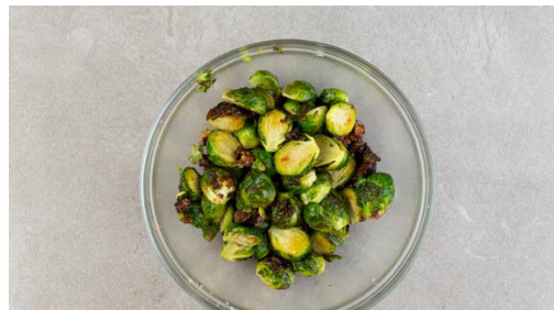
4. Rosenkohl verfeinern

Den Backofen auf 240°C (220°C Umluft) vorheizen. Eine Muffin-Backform auf einem Backblech platzieren und 6 Mulden der Backform mit je 1TL Pflanzenöl befüllen. Die Muffin-Backform auf dem Blech in den Ofen geben, während der Ofen vorheizt. Die Eier verquirlen und mit 75g Mehl und 1 kräftigen Prise Salz vermischen, nach und nach 100ml Milch zugeben und den Teig glatt rühren.