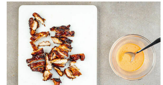
6. Dip anrühren

Die Karotten ggf. schälen, den Rotkohl halbieren und beides grob raspeln. Die Lauchzwiebeln in feine Ringe schneiden. Die Limettenschale abreiben, dann die Limette auspressen. Die Karotten , den Rotkohl , die grünen Lauchzwiebeln , 1EL Limettensaft , 2EL Olivenöl, 2EL Essig und 1 kräftigen Prise Salz vermengen, dann mit Salz und Pfeffer abschmecken.