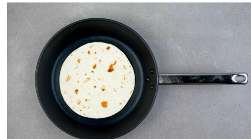
5. Tortillas erwärmen

Das Fleisch trocken tupfen, mit je 1 kräftigen Prise Salz und Pfeffer würzen und in einer großen Pfanne mit 1EL Olivenöl bei starker Hitze 6-7Min. auf einer Seite goldbraun braten, dann wenden und weitere ca. 3Min. auf der anderen Seite braten.