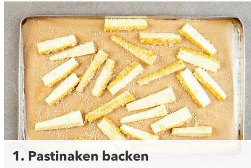
1. Pastinaken backen

Energie 1032kcal, Fett 50.9g, Kohlenhydrate 87.5g, Eiweiß 50.0g