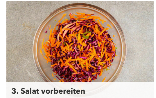
3. Salat vorbereiten

Die Tortillas nacheinander in einer großen Pfanne bei mittlerer Hitze auf jeder Seite ca. 15Sek. erwärmen. Tipp: Wenn der Ofen noch warm genug ist, können die Tortillas alternativ einige Minuten im Ofen erwärmt werden.