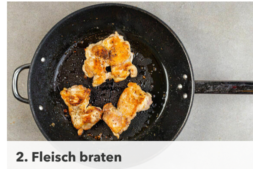
2. Fleisch braten

Den Knoblauch schälen und fein reiben, dann mit den weißen Lauchzwiebelringen , der Limettenschale , dem Ketjap Manis , 2EL Essig, 2EL Wasser und 1TL Zucker verrühren, bis sich der Zucker auflöst. Die Würzsauce über das Fleisch gießen und aufkochen, dann bei mittlerer Hitze 4-5Min. köcheln lassen, bis die Sauce eingedickt ist, dabei das Fleisch gelegentlich wenden.