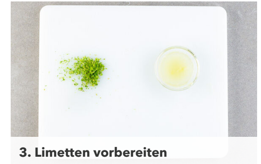
3. Limetten vorbereiten

Die \frac{1}{2} der Fischsauce mit der Limettenschale und dem Limettensaft verrühren und das Dressing mit Salz und Zucker abschmecken. Tipp: Wer mag, kann auch mehr Fischsauce verwenden. Die Karotten und die Gurken mit dem Dressing vermengen.