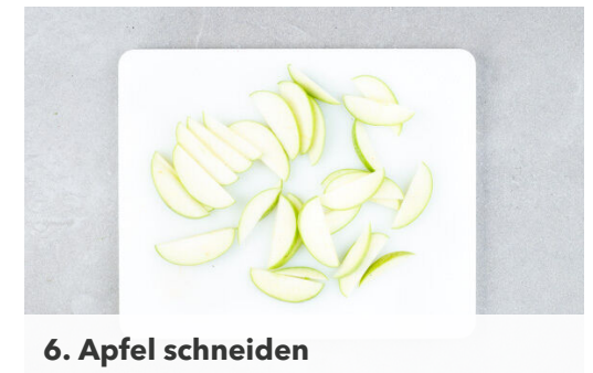
6. Apfel schneiden

Nach ca. 5Min. Garzeit den Bacon auf dem Gemüse verteilen und 12-15Min. mitbacken, bis das Gemüse gar ist. Tipp: Den gebackenen Bacon auf etwas Küchenkrepp abtropfen lassen, so wird er besonders knusprig.