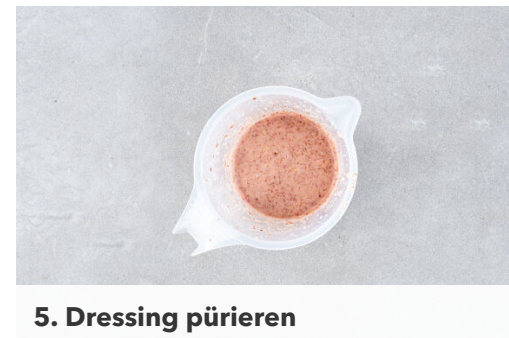
5. Dressing pürieren

Die Süßkartoffeln , den Sellerie und die ½ der Schalotte auf einem mit Backpapier ausgelegten Backblech verteilen, mit 1EL Olivenöl, ½TL Salz und 1 Prise Pfeffer vermengen und ca. 5Min. im oberen Teil des Ofens backen. Die Walnüsse grob hacken. Die Oliven grob schneiden.