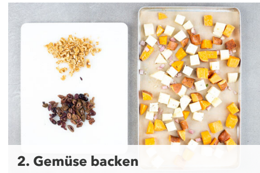
2. Gemüse backen

Die Grünkohlblätter vom Strunk befreien und in dünne Streifen schneiden, dann mit 1 kräftigen Prise Salz 1-2Min. kneten, bis der Grünkohl weich wird. Den Grünkohl auf einem zweiten mit Backpapier ausgelegten Backblech verteilen und 8-10Min. im Ofen backen, bis die Ränder knusprig und goldbraun sind.