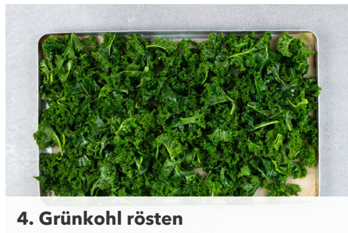
4. Grünkohl rösten

Den Backofen auf 240°C (220°C Umluft) vorheizen. Die Cranberrys mit 50ml heißem Wasser in ein hohes Gefäß geben und beiseitestellen. Die Schalotte schälen und grob würfeln. Die Süßkartoffel und die ½ des Selleries schälen und in 1-2cm große Würfel schneiden. Tipp: Wer mag, kann auch mehr Sellerie verwenden.