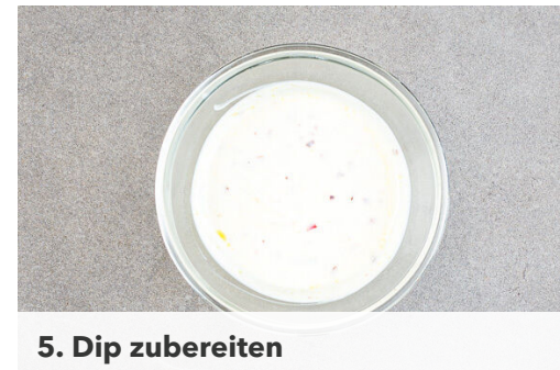
5. Dip zubereiten

Die Karotten in den Topf zu den Fenchelsamen geben und in 5-7Min. weich braten, dabei gelegentlich umrühren. Die Quinoa mit 100ml Wasser und 1 kräftigen Prise Brühgewürz hinzugeben und ca. 2Min. erhitzen, bis die Quinoa das Wasser aufgesaugt hat. Bis zum Servieren abgedeckt warm halten.