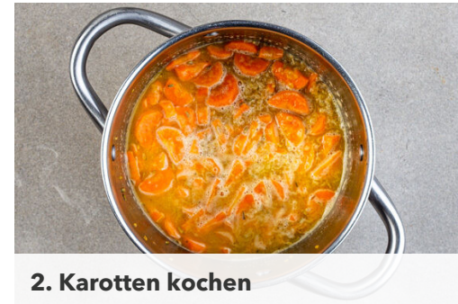
2. Karotten kochen

Die restliche Gewürzmischung mit 2EL Olivenöl und 1 kräftigen Prise Salz verrühren. Das Fleisch trocken tupfen, mit dem Würzöl einreiben und in einer großen Pfanne bei starker Hitze auf jeder Seite 2-3Min. braten, abhängig davon, ob es medium oder eher durchgebraten sein soll. Aus der Pfanne nehmen und bis zum Servieren auf einem Teller abgedeckt ruhen lassen.