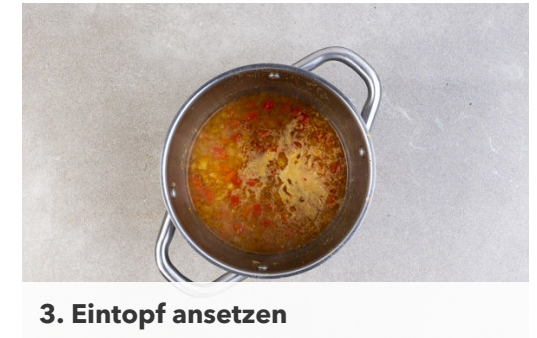
3. Eintopf ansetzen

Das Fleisch in einer großen Pfanne mit 1-2EL Olivenöl bei mittlerer bis starker Hitze 2-3Min. scharf anbraten. Die Hitze reduzieren, das Fleisch mit dem Limettensaft ablöschen und die Limettenschale unterrühren.