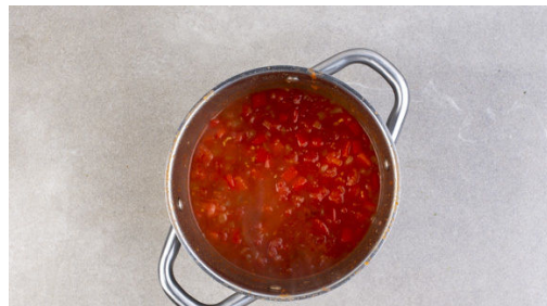
4. Tomaten zugeben

Die Paprika vierteln, entkernen und in ca. 1cm kleine Würfel schneiden. Die Zwiebeln und den Knoblauch schälen und fein würfeln. Eine Limette abreiben, halbieren und auspressen, die andere Limette in Spalten schneiden. Die Chilischote längs halbieren, entkernen und in feine Streifen schneiden.