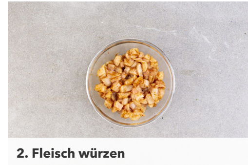
2. Fleisch würzen

Die gehackten Tomaten und die Bohnen samt Flüssigkeit unterrühren und den Eintopf 8-10Min. sanft köcheln lassen.