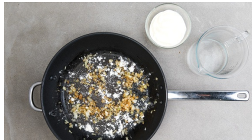
4. Sauce ansetzen

Die Karotten ggf. schälen, längs halbieren und schräg in dünne Scheiben schneiden. Den Lauch ebenfalls der Länge nach halbieren und schräg in feine Streifen schneiden. Die Zwiebel schälen, halbieren und fein würfeln. Die Petersilie samt Stängeln fein hacken.