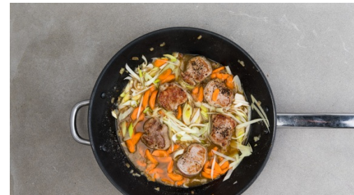
5. Sauce fertigstellen

Das Fleisch trocken tupfen, von ggf. vorhandenen Sehnen befreien und quer zur Faser in ca. 2cm dicke Medaillons schneiden.