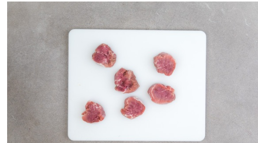
2. Fleisch schneiden

Die Zwiebeln in derselben Pfanne bei mittlerer Hitze 1-2Min. glasig anschwitzen, dann 1EL Mehl hinzufügen und unterrühren. Mit 400ml Wasser und der Crème fraîche ablöschen und die ½ des Brühgewürzes unterrühren.