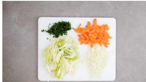
1. Gemüse vorbereiten

Energie 796kcal, Fett 36.9g, Kohlenhydrate 67.4g, Eiweiß 44.1g