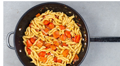
5. Pasta fertigstellen

Die Pasta in das kochende Wasser geben und in 6-8Min. bissfest kochen. Mit einer Tasse etwas Kochwasser abschöpfen, dann die Pasta ein Sieb abgießen und abtropfen lassen. Zurück in den Topf geben und warm halten.