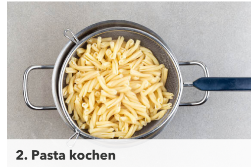
2. Pasta kochen

Die Paprika , die Zwiebeln , Peperoni nach Geschmack und die Petersilienstängel in der Pfanne mit 1EL Olivenöl bei mittlerer Hitze ca. 1min. anbraten. Dann den restlichen Bacon , die Kirschtomaten , den Knoblauch und ca. \frac{2}{3} der Petersilienblätter mit einem Schuss Kochwasser hinzugeben und 4-5Min. garen, bis das Gemüse gar ist.