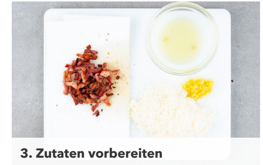
3. Zutaten vorbereiten

Das Gemüse mit \frac{1}{2} TL Zitronenschale, 1EL Zitronensaft , der \frac{1}{2} des Käses und Pfeffer nach Geschmack verfeinern. Die Pasta untermengen, dabei nach Bedarf Kochwasser hinzugeben, bis die Pasta vollständig von Sauce überzogen ist. Nach Belieben mit mehr Zitronensaft sowie Salz und Pfeffer nachwürzen.