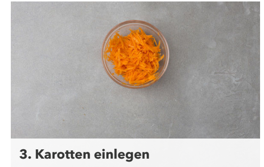
3. Karotten einlegen

Die Minzeblätter von den Stängeln zupfen und fein schneiden. Den Dill samt Stängeln ebenfalls fein schneiden.