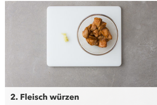
2. Fleisch würzen

Die Paprika vierteln, entkernen, in mundgerechte Stücke scheiden und in einer großen Pfanne mit 2EL Olivenöl bei mittlerer Hitze ca. 2Min. anbraten. Das Fleisch und den Knoblauch dazugeben und 4-5Min. mitbraten, bis das Fleisch gar ist. Mit Salz, Pfeffer und der restlichen Gewürzmischung abschmecken.