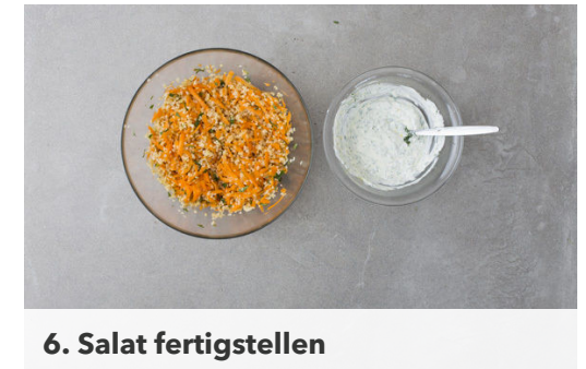
6. Salat fertigstellen

Die Karotten ggf. schälen, mit einer Küchenreibe grob raspeln und mit 3EL Essig, \frac{1}{2} -1TL Zucker und 1 Prise Salz vermengen und beiseitestellen.