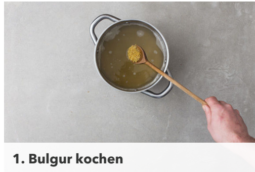
1. Bulgur kochen

Energie 619kcal, Fett 16.2g, Kohlenhydrate 66.9g, Eiweiß 42.0g