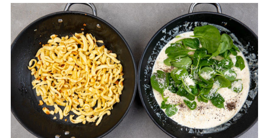
6. Spätzle braten

Die Zwiebeln und den Knoblauch in derselben Pfanne mit 1 EL Olivenöl bei mittlerer Hitze 1-2Min. anbraten. Mit 1 EL Mehl bestäuben und mit 250-300ml Wasser ablöschen, dann die ½ des Brühgewürzes unterrühren. Die getrockneten Tomaten , die Crème fraîche und das Fleisch samt Bratensatz hinzugeben und alles 4-5Min. sanft köcheln lassen.