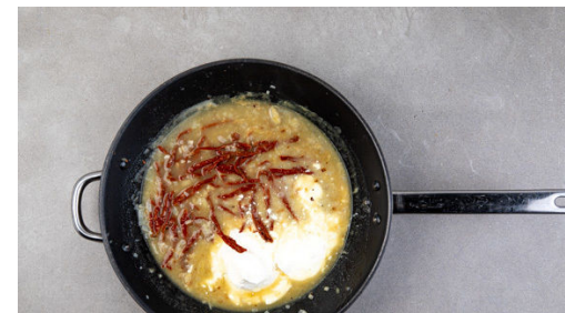
5. Sauce ansetzen

Das Fleisch in einer großen Pfanne mit 1 EL Olivenöl bei starker Hitze auf jeder Seite 1-2Min. scharf anbraten. Das Fleisch samt Bratensatz aus der Pfanne nehmen und auf einem Teller ruhen lassen.