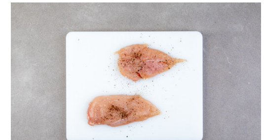
3. Fleisch vorbereiten

Die getrockneten Tomaten in feine Streifen schneiden. Den Käse fein reiben.