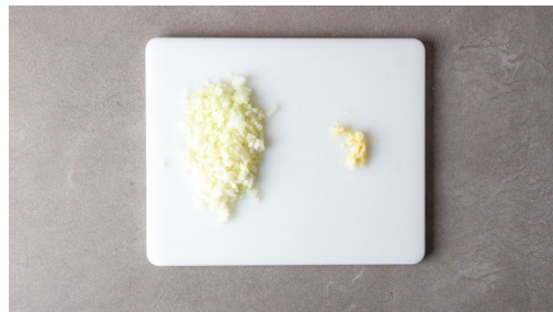
1. Zwiebel schneiden

Energie 962kcal, Fett 54.1g, Kohlenhydrate 66.6g, Eiweiß 48.3g