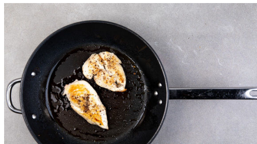
4. Fleisch braten

Das Fleisch trocken tupfen und horizontal halbieren, sodass 2 dünne Schnitzel entstehen. Mit je 1 Prise Salz und Pfeffer würzen.