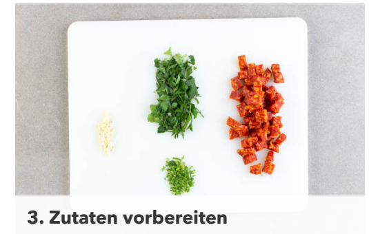
3. Zutaten vorbereiten

1EL Olivenöl, ½EL hellen Essig, ½TL Honig, ½TL Senf sowie je 1 Prise Salz und Pfeffer verrühren. Die übrigen Kirschtomaten halbieren und vorsichtig mit dem Babysalat , den Blüten und dem Dressing vermengen.