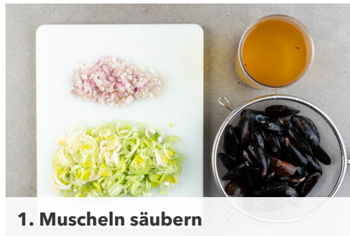
1. Muscheln säubern

Energie 983kcal, Fett 47.5g, Kohlenhydrate 107.5g, Eiweiß 29.3g