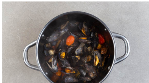
4. Muscheln garen

800ml Wasser in einem Wasserkocher aufkochen. Die Muscheln in einem Sieb mit kaltem Wasser abspülen. Offene und beschädigte Muscheln , die beim Antippen nicht schließen, entfernen. Den Safran und das Brühgewürz in dem gekochten Wasser auflösen. Den Lauch längs halbieren und quer in dünne Streifen schneiden. Die Schalotte schälen, halbieren und fein würfeln.