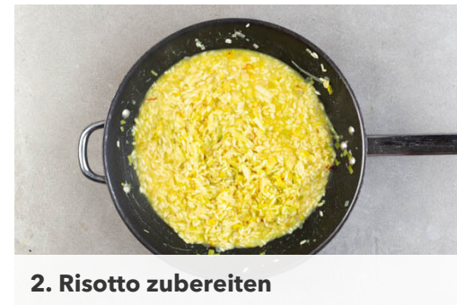
2. Risotto zubereiten

Die Chorizo in einem großen Topf mit 1EL Olivenöl bei mittlerer Hitze ca. 4Min. anbraten, dann die ½ der Kirschtomaten und die ½ des Tomatenmarks hinzufügen und bei starker Hitze ca. 4Min. mitbraten. Den Knoblauch unterrühren, dann die Muscheln mit 100ml Wasser zugeben und abgedeckt 3-4Min. dämpfen, bis die Muscheln sich öffnen.