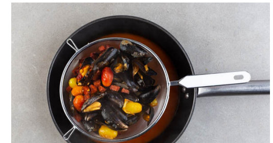
6. Risotto verfeinern

Die Petersilienblätter und -stängel separat grob und fein schneiden. Den Knoblauch schälen und fein würfeln. Die Chorizo in ca. 0,5cm große Würfel schneiden. Die Pinienkerne in einer kleinen Pfanne mit 1TL Olivenöl bei mittlerer Hitze 1-2Min. goldbraun anrösten. Vorsicht , sie können schnell zu dunkel werden. Zum Abkühlen aus der Pfanne nehmen und beiseitestellen.