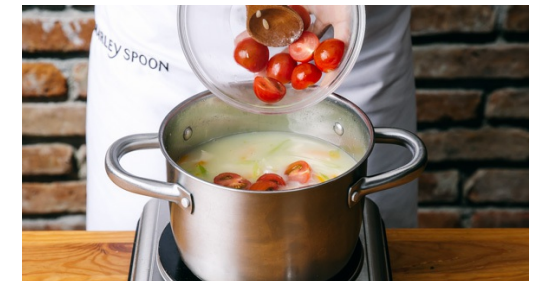
6. Suppe fertigstellen

Das Hähnchen zur Suppe hinzufügen und alles weitere ca. 6-7Min. kochen, bis die Nudeln gar und das Hähnchen durch ist.