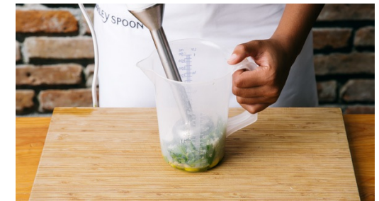
3. Pesto mischen

Den Sellerie halbieren und in dünne, schräge Scheiben schneiden. Die Knoblauchzehe schälen und in sehr feine Scheiben schneiden. Die Karotten schälen und in schräge Scheiben schneiden. Die Kirschtomaten je nach Größe halbieren oder vierteln.