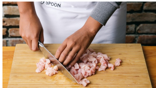
1. Hähnchen schneiden

Energie 640kcal, Fett 25.1g, Kohlenhydrate 58.5g, Eiweiß 42.1g