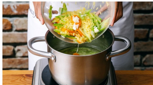
4. Suppe ansetzen

Den Käse grob reiben. Die Basilikumblätter abzupfen und mit den Cashews , Käse und 3-4EL Olivenöl in ein hohes Gefäß geben. Mit einem Stabmixer zu einem dicken Pesto pürieren und mit Salz und Pfeffer abschmecken.