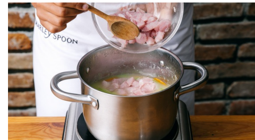
5. Hähnchen hinzufügen

Sobald das Wasser kocht, den Brühwürfel darin auflösen, die Pasta sowie den Sellerie , Karotten und Knoblauch hinzufügen und für ca. 3-4Min. kochen lassen.